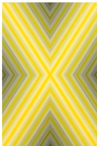
DAVID MALEK Big X , 2009 183 X 122 cm Peinture email sur bois

Conscient de ces valeurs communes, David Malek confirme sa clairvoyance avec la fresque murale qu'il exécute dans la boutique éphémère de la maison. Conçue dans une palette de jaune-orangé, l'oeuvre souligne la justesse des coupes et la noblesse des matières. Parti du symbole "X" qu'il affectionne particulièrement, l'artiste offre là une nouvelle dimension à son travail. Mieux, la géométrie de sa peinture transpose les tissages emblématiques de Cerruti en oeuvre d'art. Le chevron s'expose.