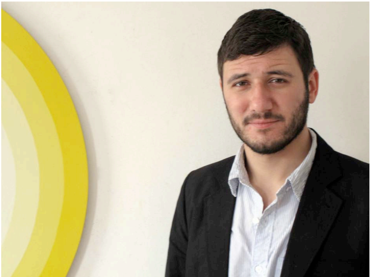
David Malek © Cerruti D.R.

Le détournement des formes pour une succession de rythmes, de grilles, de lumière rejoint l'historicité du suprématisme et donne lieu à un ensemble aussi varié que fascinant. La rigueur des formes fait appel à l'imagination afin de saisir la beauté des couleurs.